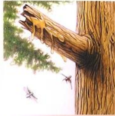
③ 台風で枝や幹が折れる 樹木の傷から分泌される樹脂…