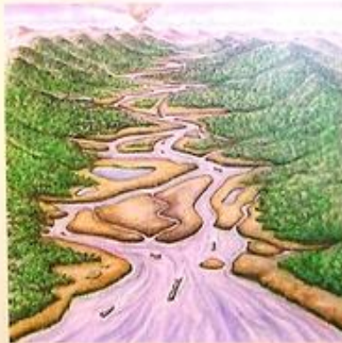
⑥ 洪水により河川に流出 土砂・倒木・樹幹の断片も流出…