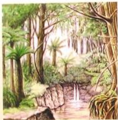
① 白亜紀後期の原生林 うっそうと繁る樹木…