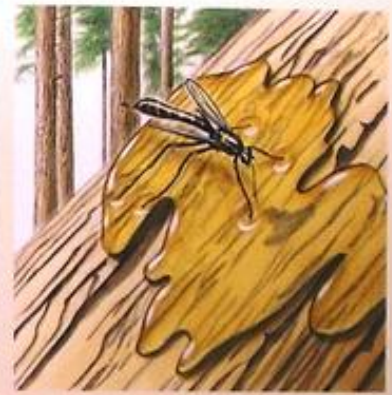
④ 森林は昆虫の棲み家 樹脂に包み込まれる昆虫たち…