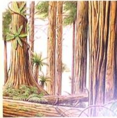
② 針葉樹が主体の森林 樹脂を分泌する樹木の繁茂…