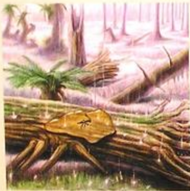
⑤ 老木化し枯死した樹木 大雨と洪水が地表を侵食する…