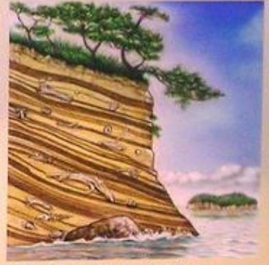
⑧ 数千万年を経て化石化 地盤の隆起で地層が地上に露出

Labai seniai miškuose augo sakingos pušys. Klimatui atšilus, jų sakai ėmė tekėti ant žemės, maišėsi su ja, kietėjo. Susikaupusius sakus išplaudavo upės ir nešdavo į jūrą, kur sakai virto dabartiniu gintaru.